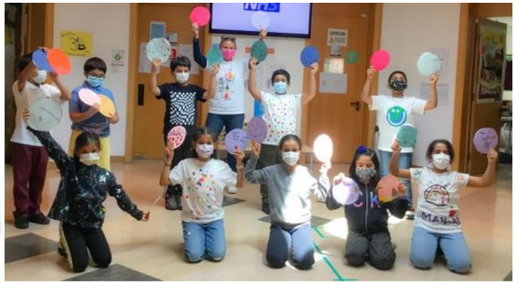
Grade 3 students and teachers are proud to share their 'Dots of Kindness'

Qatar Academy Doha - Primary 7 th October 2021