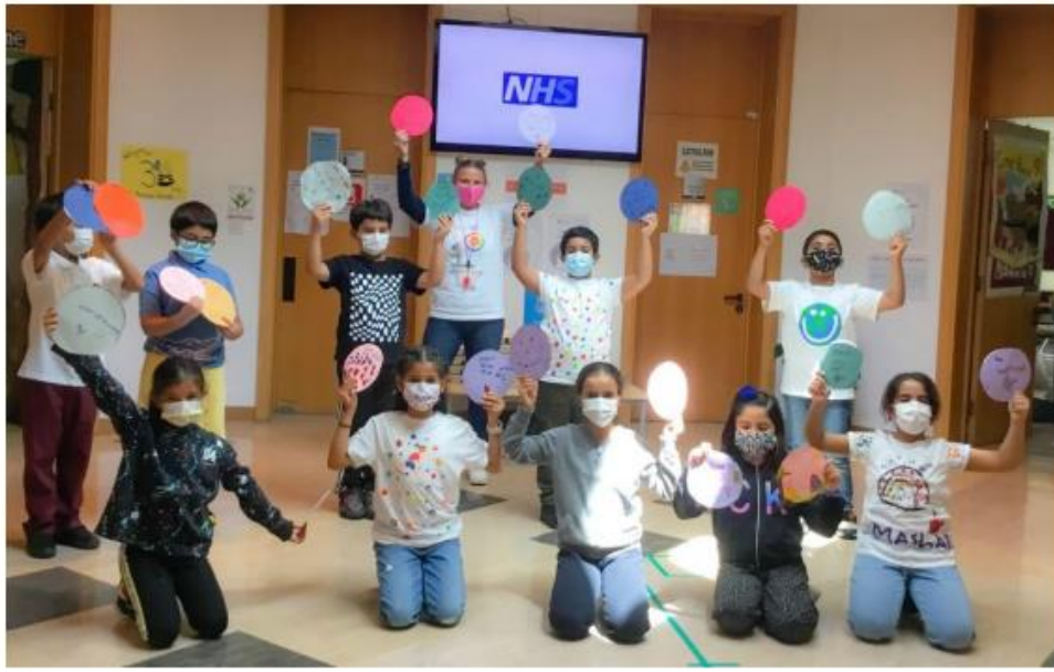
Grade 3 students and teachers are proud to share their 'Dots of Kindness'