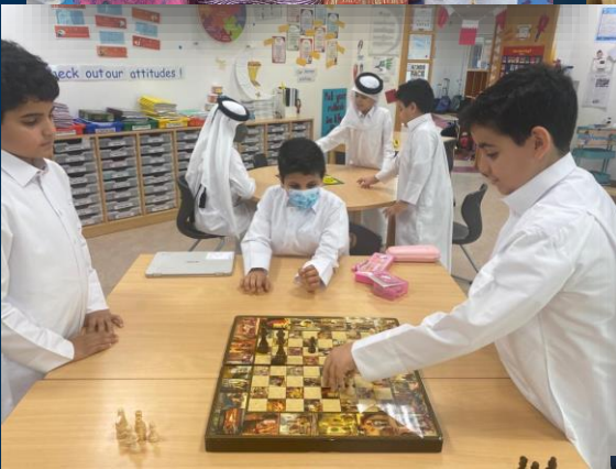
Garango Traditional Games