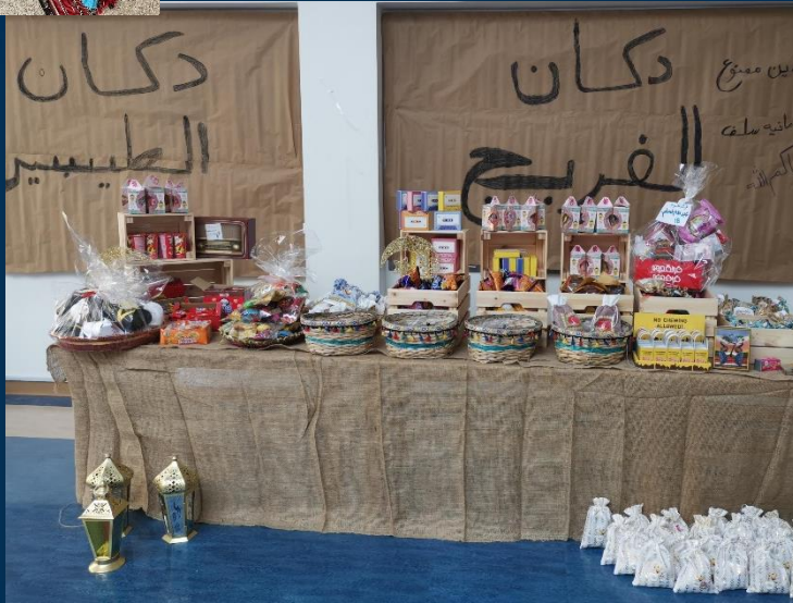
“Dukan Al Fereej”, market for Garangao’s sweets and candies.